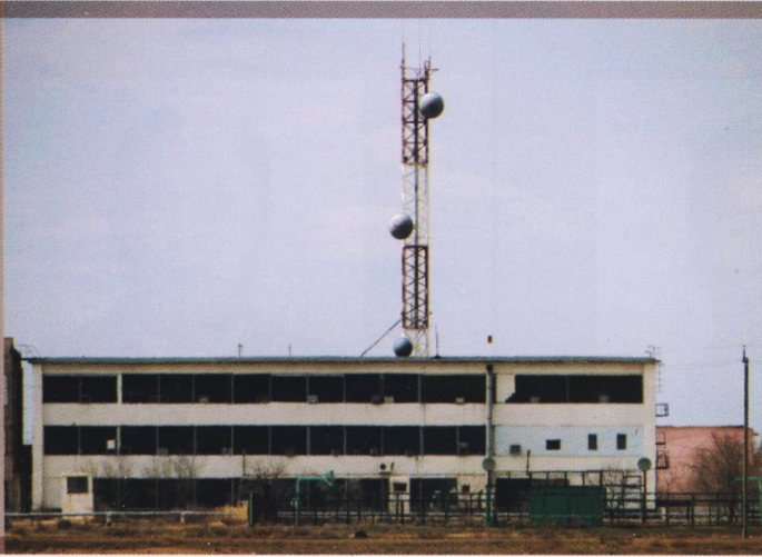
Здание на пл. 95, где располагался опорный узел связи «Суффикс»

журной смены боевого управления в утверждённые контрольные сроки и готовность средств боевого управления и связи к немедленному применению.