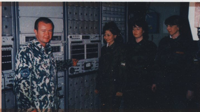
Занятие по специальной подготовке